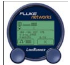
Localice con precisión los puertos del conmutador con el protocolo CDP.