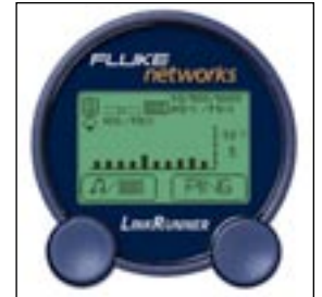
Vea las funciones de los dispositivos, la velocidad real del enlace y los niveles de utilización.