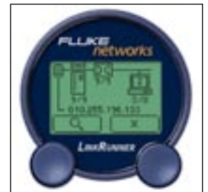
Realice pings al servidor DNS o a los dispositivos clave, y observe los tiempos de respuesta.